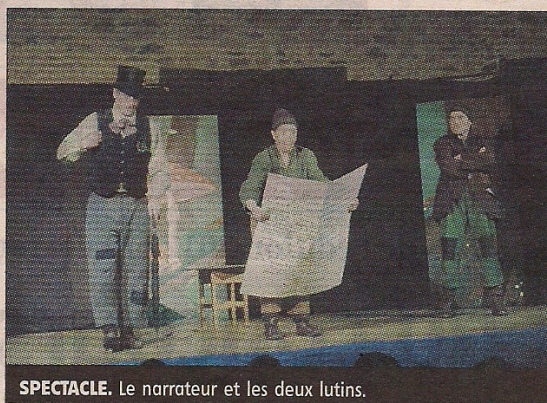
SPECTACLE. Le narrateur et les deux lutins.

Quelques jours avant les vacances de Noël, la compagnie « Les petits riens » a présenté un spectacle de Noël aux enfants de l'école de Glandon. La compagnie est originaire de la région parisienne et s'est installée sur la commune de Glandon à la fin de l'été 2012. Elle se produit sur scène, dans la rue et dans d'autres lieux intéressants. Elle crée ses propres spectacles ou en adapte certains. Le spectacle présenté à l'école de Glandon s'intitulait « La boîte à chaussures » et mettait en scènes de curieux personnages, un narrateur un peu farfelu, en fait un scientifique spécialiste des « lutins » et deux lutins espiègles dont un avait toujours faim. Il